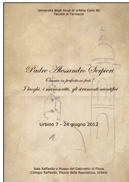
Mostra Archivio Serpieri Giugno 2012